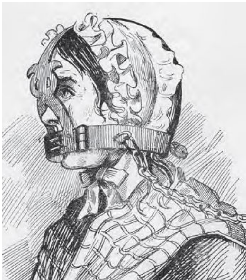
تصویر ۲: ابزار شکنجه زنان در انگلستان قرون وسطی ۱