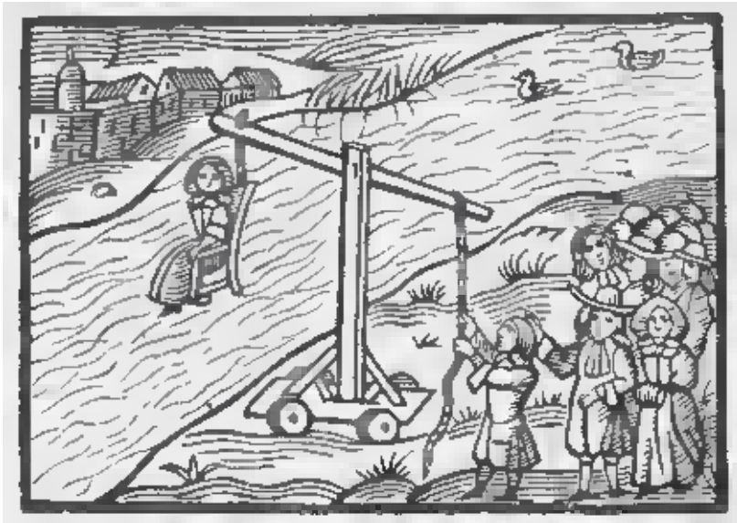
تصویر ۱: ابزار شکنجه زنان در انگلستان قرون وسطی ۱

مجازات‌های شرم‌آورتر از این نیز وجود داشت به نام «افسار سرزنش» ۲ که انواع مختلفی داشت؛ اما در اصل یکسان و متشکل از یک قاب آهنی بود که روی سر نصب می‌شد. زنی که قرار بود مجازات شود را به همراه این سرپوش در خیابان‌ها جابه‌جا، یا با گاری حمل می‌کردند و یا بر روی سکویی برای تماشا به ستون می‌بستند. ۳